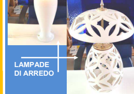
LAMPADE DI ARREDO

€ 1.000 -Ringraziamento pubblico sul sito del Comune di Falerone -Oggetto artistico di arredamento: abat-jour, paralume, lampada da tavolo, ecc... ideato e realizzato da coop.va artigiani e vetrate artistiche o incisione realizzata da un noto artista -N. 4 biglietti per la stagione teatrale estiva 2018 presso il Teatro Romano sito nella zona archeologica "Falerio Picenus" -Attestato di benemerenzza da parte del Comune di Falerone -Iscrizione del nome del beneficiatore su piastrella da apporre sulla "parete dei beneficiatori" presso il "Beato Pellegrino"