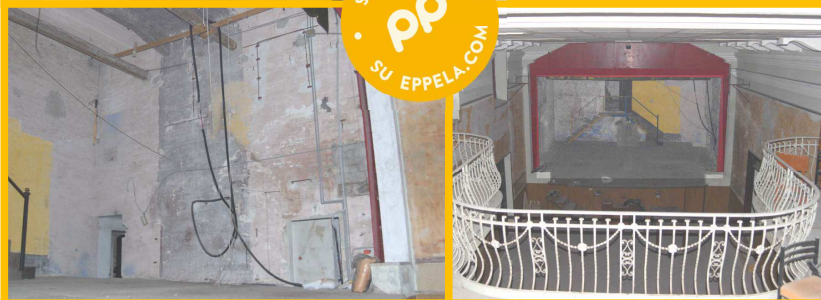
CINE-TEATRO "BEATO PELLEGRINO" - STATO ATTUALE